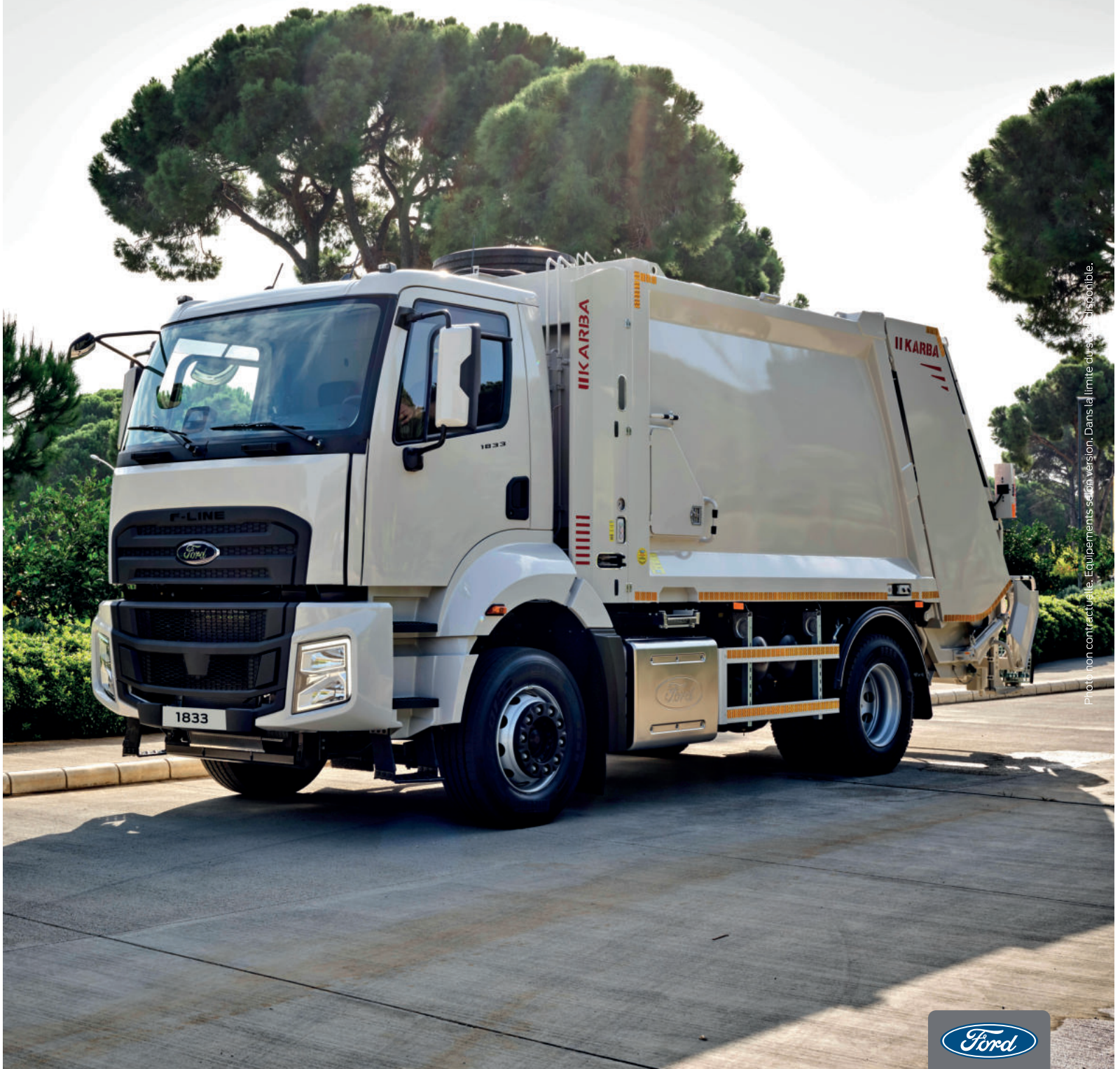
Photo non contractuelle. Equipements selon version. Dans la limite du stock disponible.